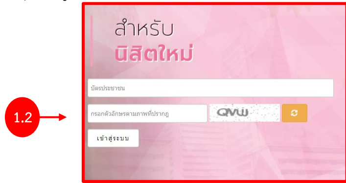
รูปที่ 1 แสดงหน้าจอการเข้าสู่ระบบงานหอพัก